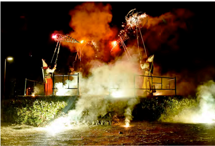
Compagnie KARNAVIRES Night of Light